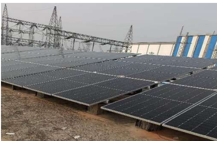
SPV Power Plant installed at Power Grid Corporation Limited

Apart from this, Company has executed multiple solar installations across the country, including cumulative 2,058.10 kWp grid-connected SPV power plants at Power Grid buildings and substations across Northern, Western, North-Eastern and Southern regions under orders from PESL. In Jammu & Kashmir, a total of 1,408 kWp SPV power plants were commissioned at Government buildings for JAKEDA. The Company also executed rooftop SPV projects for NVVN at ITI Mankapur (700 kWp), ITI Rae Bareilly (300 kWp) and HCL Navi Mumbai (250 kWp) along with a 425 kWp rooftop SPV installation at MECL, Nagpur.