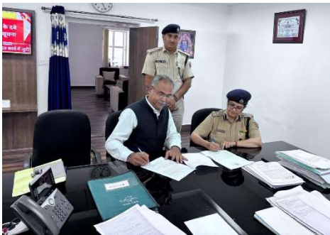
Signing of MoU between REIL & Prison Department, Government of Rajasthan

The Company signed an Agreement with the Prison Department, Government of Rajasthan to provide Physical Efficiency Test (PET) and Physical Standard Test (PST) services for the Jail Prahari Recruitment process scheduled from 18.12.2025 to 01.01.2026. This marks the Company's entry into a new operational segment within the recruitment support services.