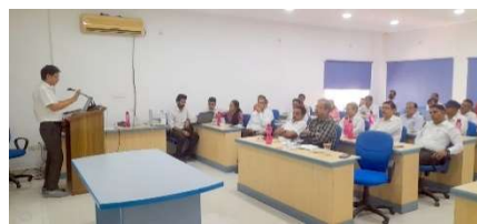
Glimpse of training sessions by R&D