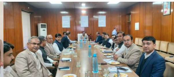
JS MHI interacting with REIL officials during his visit to REIL works