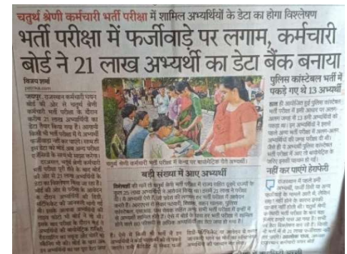
Press news regarding successful conduct of examination

All examinations were executed securely and in accordance with prescribed protocols.