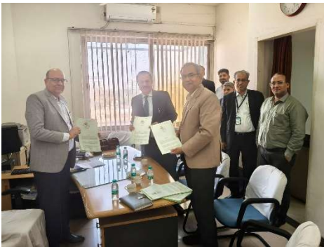
A tripartite agreement between RSCB, REIL & TCS signed on 02.12.2025