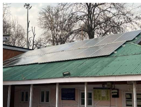
SPV Power Plant installed at J&K

Building on its successful execution of solar power plant and street lighting projects in the challenging terrain of Jammu & Kashmir, the Company has secured multiple new orders from JAKEDA. These include an order for installation of 5 MWp cumulative capacity of grid-connected Solar PV power plants at Government buildings across the region, valued at ₹26 crore, along with another order for 300 Solar PV LED Street Light Systems worth ₹1.55 crore.