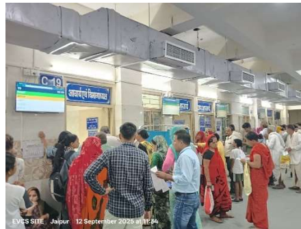
QMS implementation at SMS Hospital Jaipur

Hospital for implementing the Laser Printer-as-a-Service (LPaaS) model along with additional supplies for Jaipuria Hospital under the QMS project.