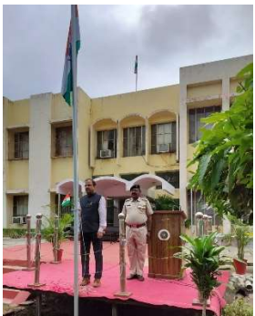
स्वच्छता पखवाड़ा शपथ

डॉ. श्यामा मुखर्जी की जयंती पर व्याख्यान सत्र