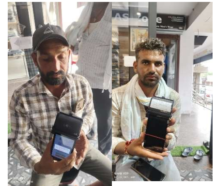
POS machines in use by the dealers

In addition, REIL completed the upgradation of 9,895 POS machines across Rajasthan for RSFCL significantly improving transaction efficiency, system performance, and operational reliability.