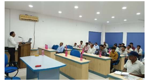
Glimpse of the training session

The sessions concluded on a constructive and interactive note with feedback collected from participants to further improve future initiatives.