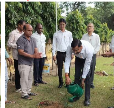
राष्ट्रीय खेल दिवस