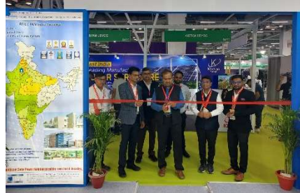
MD REIL & REIL Team at RE Expo

were also present. Ideas were shared by CEOs regarding further opportunities in renewable energy, grid stability, etc. MD REIL shared his insights on decoding pathways to achieve net zero in India's renewable energy sector.