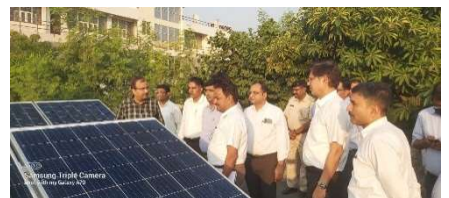
MD REIL inaugurating the 25kWp SPV Power plant installed on the canteen rooftop at REIL campus